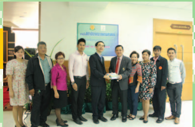
คณะวิทยาศาสตร์ฯ ครบรอบ 30 ปี เมื่อวันที่ 31 มีนาคม 2559