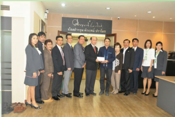
คณะแพทยศาสตร์ ครบรอบ 26 ปี เมื่อวันที่ 25 มีนาคม 2559