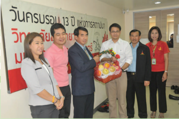
วิทยาลัยสหวิทยาการ ครบรอบ 13 ปี วันที่ 5 กุมภาพันธ์ 2559

สหกรณ์ออมทรัพย์มหาวิทยาลัยธรรมศาสตร์ จำกัด ร่วมกิจกรรมของมหาวิทยาลัยและหน่วยงานต่างๆ ของมหาวิทยาลัยในโอกาสสำคัญ ดังนี้