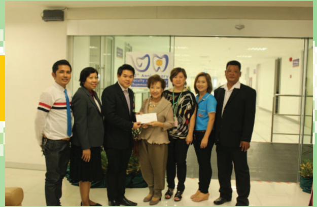
สถาบันไทยคดีศึกษาครบรอบ 45 ปี เมื่อวันที่ 3 มีนาคม 2559