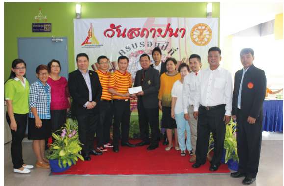
สอมธ. ร่วมแสดงความยินดีกับสำนักงาน จัดการทรัพย์สิน ครบรอบ 17 ปี เมื่อวันที่ 13 พฤษภาคม 2559 ณ มธ. ศูนย์รังสิต