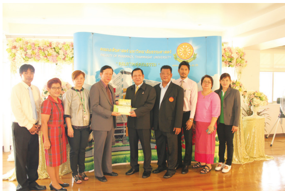
สอมธ. ร่วมแสดงความยินดีกับคณะเภสัชศาสตร์ ครบรอบ 4 ปี เมื่อวันที่ 29 เมษายน 2559 ณ มธ. ศูนย์รังสิต