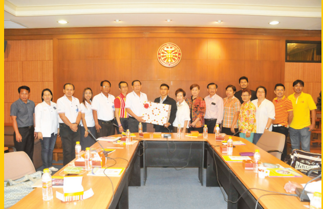
สอ.ครูสุรินทร์ จำกัด เมื่อวันที่ 23 เมษายน 2559 ณ สำนักงานท่าพระจันทร์