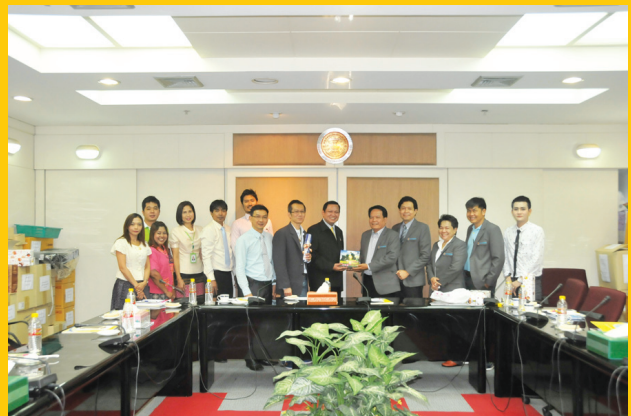
สอ.สาธารณสุขชัยภูมิ จำกัด เมื่อวันที่ 29 เมษายน 2559 ณ สำนักงานท่าพระจันทร์