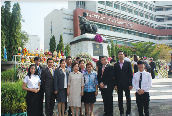
สอมธ. ร่วมพิธีวางพานพุ่มเพื่อสักการะอนุสาวรีย์ ศาสตราจารย์สัญญา ธรรมศักดิ์ เมื่อวันที่ 5 เมษายน 2559 ณ มธ. ศูนย์รังสิต