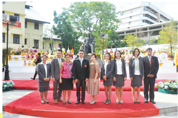
สอมธ. ร่วมพิธีวางพานพุ่มเพื่อสักการะอนุสาวรีย์ศาสตราจารย์ปรีดี พนมยงค์ เมื่อวันที่ 11 พฤษภาคม 2559 ณ ลานปรีดี มธ. ท่าพระจันทร์ พร้อมนี้ สอมธ. ได้มอบเงินสนับสนุนการออกร้านอาหารเป็นจำนวนเงิน 10,000.00 บาท