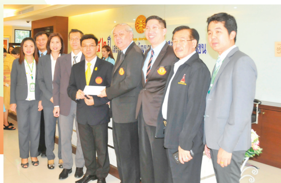
สอมธ. ร่วมแสดงความยินดีกับสำนักเสริมศึกษา ครบรอบ 42 ปี เมื่อวันที่ 23 พฤษภาคม 2559 ณ มธ. ท่าพระจันทร์