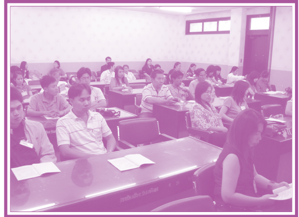
สำนักงานประสานศูนย์การศึกษากุมิภาค เมื่อวันที่ 18 มีนาคม 2552 มอบเงินสนับสนุนจำนวน 4,300 บาท