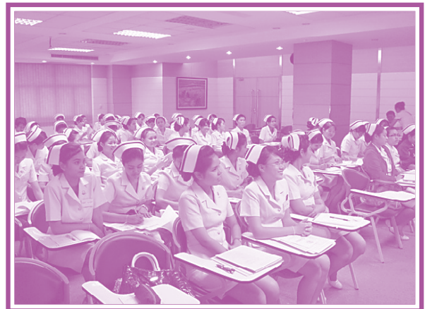
โรงพยาบาลธรรมศาสตร์ฯ เมื่อวันที่ 1 เมษายน 2552 มอบเงินสนับสนุนจำนวน 10,000 บาท