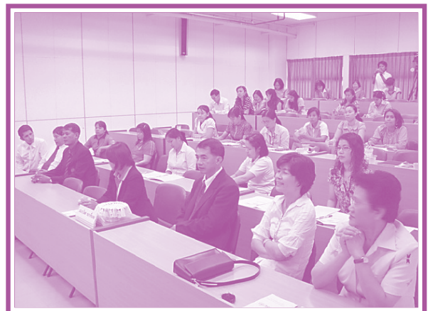
คณะพยาบาลศาสตร์ เมื่อวันที่ 2 เมษายน 2552 มอบเงินสนับสนุนจำนวน 8,900 บาท