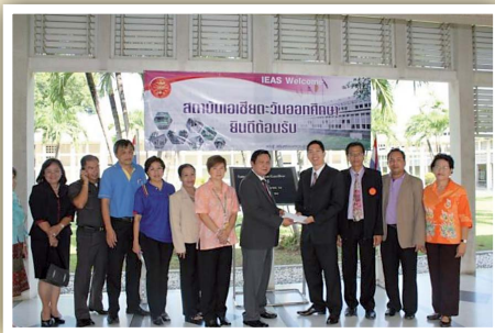
สถาบันเอเชียตะวันออกเฉียงใต้ศึกษา ครบรอบ 26 ปี เมื่อวันที่ 17 มิถุนายน 2554