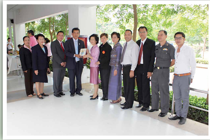
คณะพยาบาลศาสตร์ ครอบรอบ 15 ปี เมื่อวันที่ 28 มิถุนายน 2554

สอมธ. โดยคณะกรรมการ ได้เข้าร่วมแสดงความยินดีในโอกาสที่หน่วยงานต่างๆ ของมหาวิทยาลัย ครอบรอบการก่อตั้ง