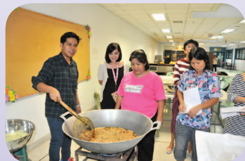
หลักสูตรน้ำพริกกุ้งเสียบสมุนไพรและน้ำพริกกุ้งแแก้ว ท่าพระจันทร์ วันที่ 6 กรกฎาคม 2556 และ ศูนย์รังสิต วันที่ 17 กรกฎาคม 2556