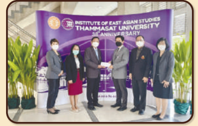
สถาบันเอเชียตะวันออกเฉียงใต้ศึกษา ครบรอบ 38 ปี แห่งการก่อตั้ง ณ สถาบันเอเชีย มธ. ศูนย์รังสิต เมื่อวันที่ 17 มิถุนายน 2565