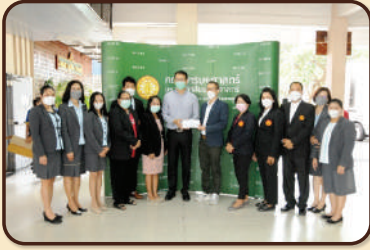
คณะศึกษาศาสตร์ ครบรอบ 73 ปี แห่งการก่อตั้ง ณ คณะศึกษาศาสตร์ มธ. ทำพระจันทร์ เมื่อวันที่ 14 มิถุนายน 2565

สอสมธ. ร่วมแสดงความยินดีในโอกาสที่หน่วยงานต่าง ๆ ของมหาวิทยาลัยฯ ครบรอบการก่อตั้ง ดังนี้