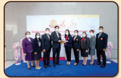
คณะพยาบาลศาสตร์ ครบรอบ 26 ปี แห่งการก่อตั้ง ณ ห้อง 2014 อาคารเรียนและปฏิบัติการรวม มธ. ศูนย์รังสิต เมื่อวันที่ 28 มิถุนายน 2565