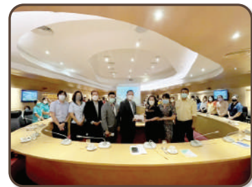
บรรยายให้กับสมาชิกสังกัดกองคลังและกองบริหารการคลัง กลุ่มการธุรกิจ เมื่อวันที่ 22 มิถุนายน 2565 พร้อมสนับสนุนการจัดการสัมมนา จำนวน 8,880 บาท