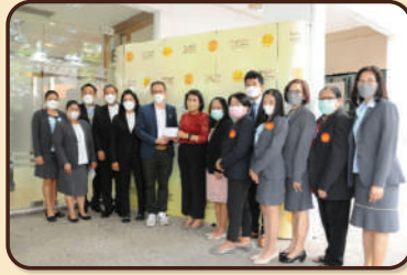
คณะวิทยาศาสตร์ ครบรอบ 73 ปี แห่งการก่อตั้ง ณ ห้องประชุม ศ.ทวี แรงขำ มธ. ทำพระจันทร์ เมื่อวันที่ 14 มิถุนายน 2565