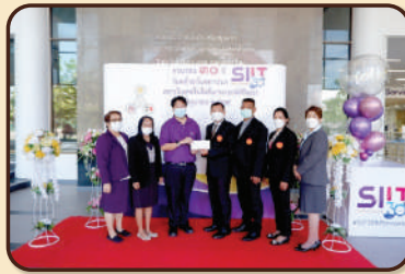
สถาบันเทคโนโลยีนานาชาติสิรินธร ครบรอบ 30 ปี แห่งการก่อตั้ง ณ บริเวณโถงชั้น 1 อาคารเรียนและ สำนักงานสถาบันฯ มธ. ศูนย์รังสิต เมื่อวันที่ 28 มิถุนายน 2565