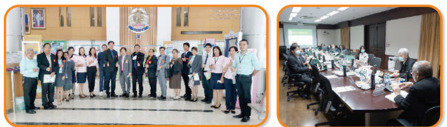
สหกรณ์ออมทรัพย์จุฬาลงกรณ์มหาวิทยาลัย จำกัด เมื่อวันที่ 23 มิถุนายน 2565