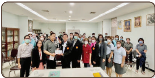
บรรยายให้กับสมาชิกสังกัดโรงพิมพ์ มธ. เมื่อวันที่ 16 มิถุนายน 2565 พร้อมสนับสนุนการจัดการสัมมนา จำนวน 4,920 บาท

สอสมธ. บรรยายให้ความรู้เรื่องการให้บริการ และสวัสดิการของสหกรณ์ แลกเปลี่ยนความคิดเห็นกับสมาชิก ในโอกาสที่หน่วยงานจัดสัมมนาของหน่วยงาน พร้อมสนับสนุนเงินในการจัดสัมมนา