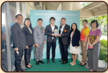
สำนักงานศูนย์เทคโนโลยีสารสนเทศและ การสื่อสาร ครบรอบ 40 ปี แห่งการก่อตั้ง ณ สำนักงานศูนย์ฯ อาคารวิทยบริการ มธ. ศูนย์รังสิต เมื่อวันที่ 24 มิถุนายน 2565