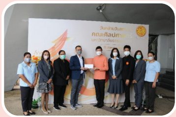
คณะศิลปศาสตร์ ครบรอบ 60 ปี แห่งการก่อตั้ง วันที่ 15 สิงหาคม 2565

สอ.มธ. ร่วมแสดงความยินดี ในโอกาสที่หน่วยงานต่าง ๆ ของมหาวิทยาลัยฯ ครบรอบการก่อตั้ง ดังนี้