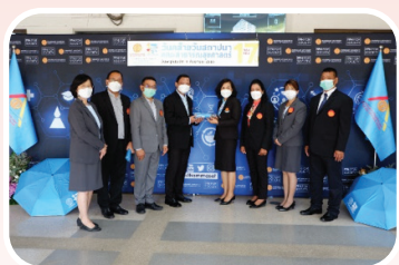
คณะสาธารณสุขศาสตร์ ครบรอบ 17 ปี แห่งการก่อตั้ง วันที่ 1 กันยายน 2565