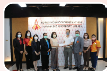
หอสมุดแห่งมหาวิทยาลัยธรรมศาสตร์ ครบรอบ 86 ปี แห่งการก่อตั้ง วันที่ 2 กันยายน 2565