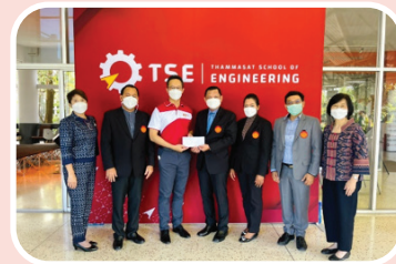
คณะวิศวกรรมศาสตร์ ครบรอบ 33 ปี แห่งการก่อตั้ง ณ มธ. ศูนย์รังสิต วันที่ 19 สิงหาคม 2565