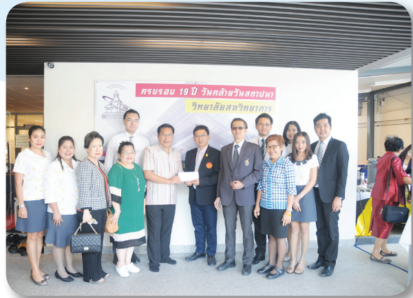
วิทยาลัยนวัตกรรมการเรียนการสอน เนื่องในโอกาสครบรอบ 21 ปี เมื่อวันที่ 9 กุมภาพันธ์ 2561