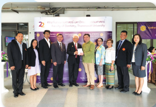
คณะทันตแพทยศาสตร์ เนื่องในโอกาสครบรอบ 22 ปี เมื่อวันที่ 21 กุมภาพันธ์ 2561