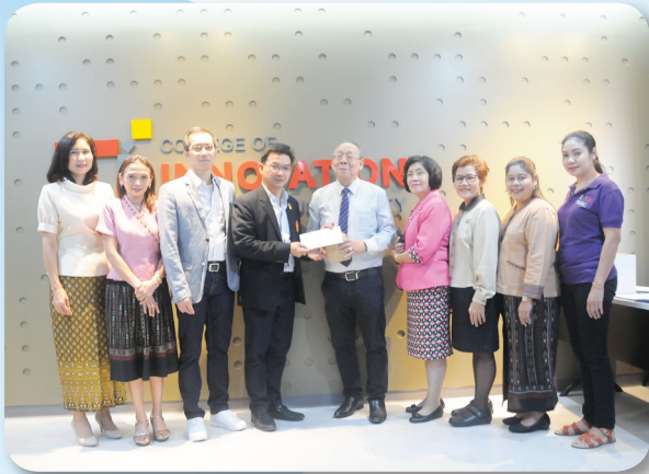
วิทยาลัยสหวิทยาการ เนื่องในโอกาสครบรอบ 15 ปี เมื่อวันที่ 6 กุมภาพันธ์ 2561

สหกรณ์ออมทรัพย์มหาวิทยาลัยธรรมศาสตร์ จำกัด ร่วมกิจกรรมของมหาวิทยาลัยและหน่วยงานต่างๆ ของมหาวิทยาลัยในโอกาสสำคัญ ดังนี้