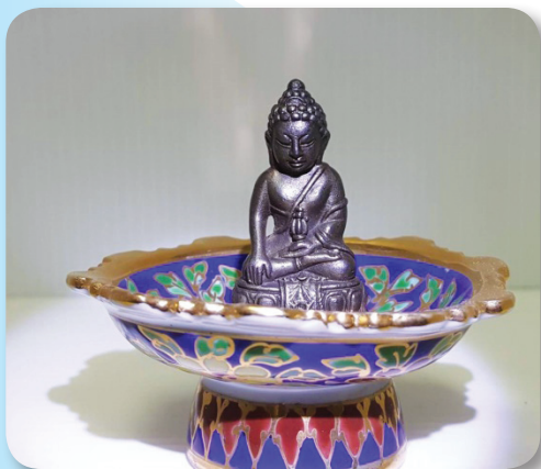
พระกริ่ง 50 ปี มธ.