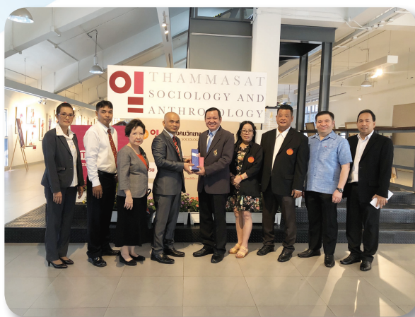
คณะสังคมวิทยาและมานุษยวิทยา เนื่องในโอกาสครบรอบ 53 ปี เมื่อวันที่ 16 กุมภาพันธ์ 2561