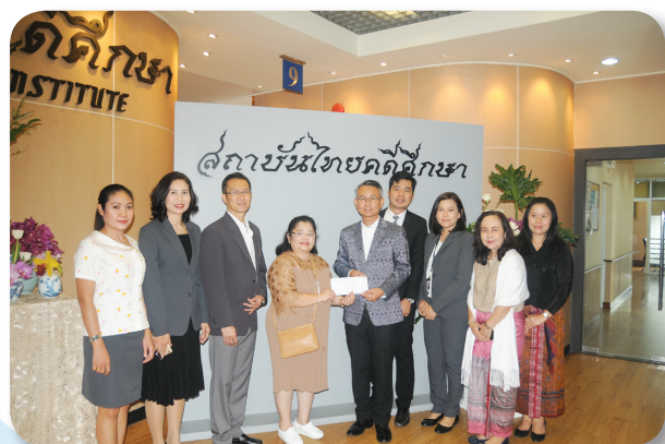
สถาบันไทยคดีศึกษา เนื่องในโอกาสครบรอบ 47 ปี เมื่อวันที่ 27 กุมภาพันธ์ 2561