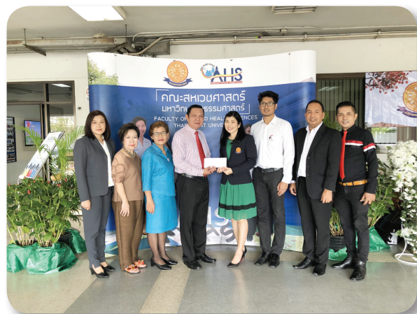
คณะสหเวชศาสตร์ เนื่องในโอกาสครบรอบ 22 ปี เมื่อวันที่ 20 กุมภาพันธ์ 2561