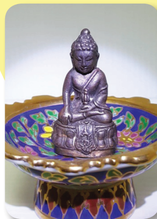
พระกริ่ง 60 ปี มธ.