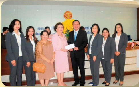
สถาบันเสริมศึกษาและทรัพยากรมนุษย์ ในโอกาสครบรอบ 1 ปี เมื่อวันที่ 4 มิถุนายน 2561