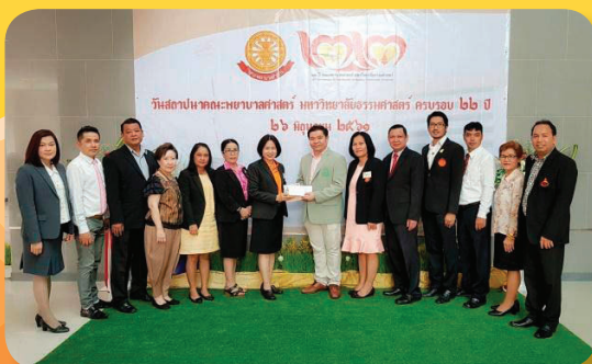
คณะพยาบาลศาสตร์ ในโอกาสครบรอบ 22 ปี เมื่อวันที่ 26 มิถุนายน 2561