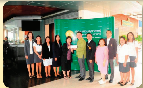
คณะเศรษฐศาสตร์ ในโอกาสครบรอบ 69 ปี เมื่อวันที่ 14 มิถุนายน 2561