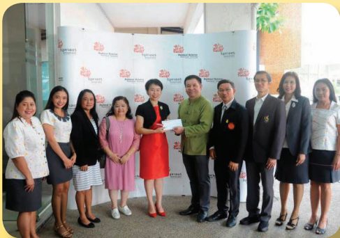
คณะรัฐศาสตร์ ในโอกาสครบรอบ 69 ปี เมื่อวันที่ 14 มิถุนายน 2561