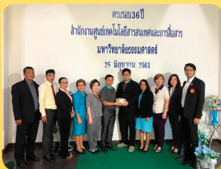
สนง. ศูนย์เทคโนโลยีสารสนเทศและการสื่อสารครบรอบ 36 ปี เมื่อวันที่ 25 มิถุนายน 2561