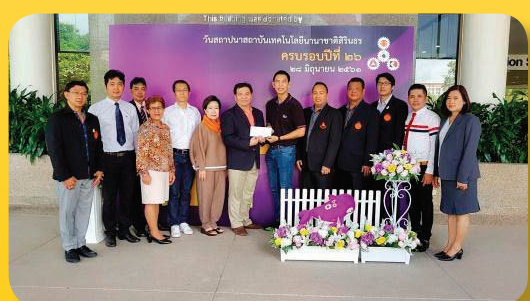
สถาบันเทคโนโลยีนานาชาติสิรินธร ในโอกาสครบรอบ 26 ปี เมื่อวันที่ 28 มิถุนายน 2561