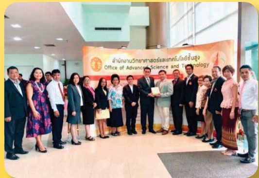
สนง. วิทยาศาสตร์และเทคโนโลยีขั้นสูง ครบรอบ 2 ปี เมื่อวันที่ 26 มิถุนายน 2561