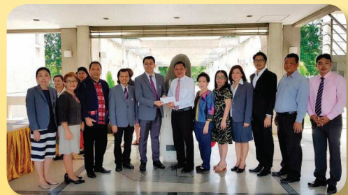
สถาบันเอเชียตะวันออกเฉียงใต้ศึกษา ในโอกาสครบรอบ 33 ปี เมื่อวันที่ 19 มิถุนายน 2561